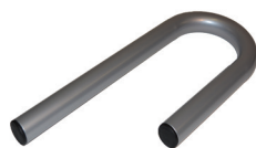
Bügel für Sitz Gripo Alu