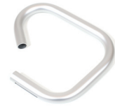
Hängegriff für Krankenpfleger- unterstützung