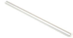
Rohr Ø22 mm für beidhändigen Griff L - 470 mm