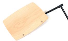
Tisch, rechteckig, 41x31 cm ohne Universalanschluss