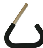
Griffbügel Triangel mit Moosgummi