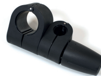
Universalanschluss mit Gelenk Ø22 für Geländerrohr Ø22