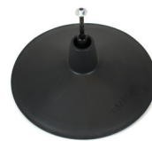
Obere Abschlussplatte, komplett mit Gasdruckfeder