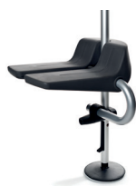
Klappsitz, komplett Komplett mit Universalanschluss