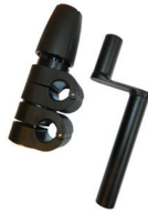
Toilettenpapierhalter, komplett mit Universalanschluss 22/22