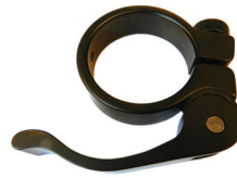
Quick Release Schnellverschluss S