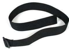
Halterriemen für Krankenpfleger- unterstützung