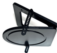
Obere Abschlussplatte, einstellbar, Schrägdach