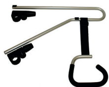
Krankenpflegerunterstützung, komplett mit 2 Universalanschlüssen