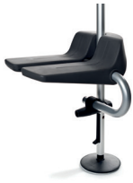
Klappsitz ohne Universalanschluss ohne Universalanschluss