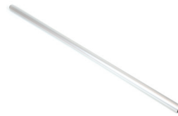
Geländerrohr, 160cm Ø40 mm