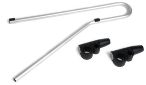
Krankenfleger- unterstützung als seitliche Stütze mit 2 Universalanschlüssen