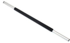
Geländerrohr, 75 cm Ø22 mm, mit Moosgummi