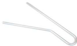
Rohr f. Krankenpfleger- unterstützung