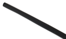
Moosgummi ABH Ø22x440, schwarz