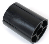
Spannfutter ohne Gewindeeinsatz (Zytel 806-14-NC10)