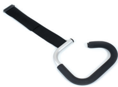
Hängegriff für Krankenfleger- unterstützung ohne Halteriemen