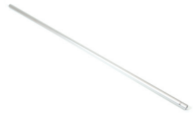
Innenrohr, 1600 mm