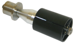
Spannfutter mit Konus und Schraube komplett