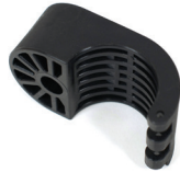
Halterung 40 mm für Universalanschluss