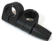
Universalanschluss mit Gelenk Ø40 für Geländerrohr Ø40