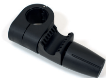
Universalanschluss mit Aufnahme Ø22 für Geländerrohr Ø22