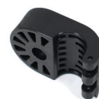
Halterung 22mm für Universalanschluss