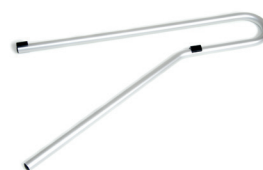
Rohr f. Krankenpfleger- unterstützung mit Gleit- stopper und Abschlussstopfen