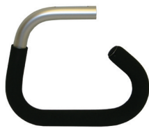
Hängegriff für Krankenfleger- unterstützung mit Moosgummi, Halteriemen und Abschlussplatte