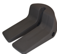
Sitz Gripo Alu