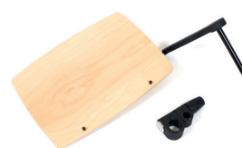
Tisch, rechteckig, 41x31 cm Komplett mit Universalanschluss