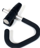
Griffbügel Triangel, komplett mit Universalanschluss