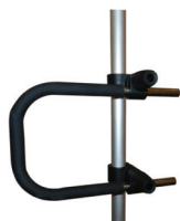
Kombi-Griff, komplett mit 2 Universalanschlüssen