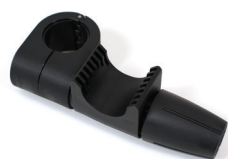
Universalanschluss mit Aufnahme Ø40 für Geländerrohr Ø40