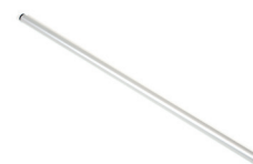
Geländerrohr, 75 cm Ø22 mm