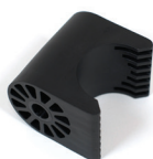
Halterung Ø40 mm, offen für Universalanschluss mit Aufnahme