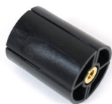
Spannfutter mit Gewindeeinsatz (Zytel 806-14-NC10)