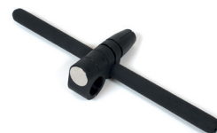
Beidhändiger Griff, komplett mit Universalanschluss