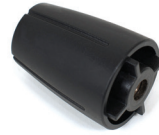
Handrad mit Gewindeeinsatz für Universalanschluss