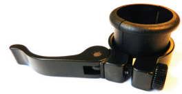
Erweiterung Verschluss- mechanismus mit Verschlussklemme